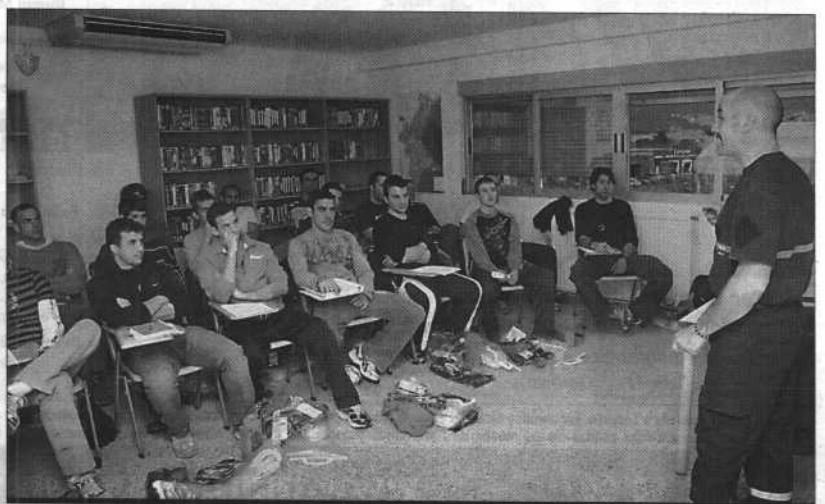
Estudiantes en una de las clases prácticas realizadas en el parque de bomberos.

Este curso está dirigido a personas que preparan las oposiciones para bombero. "La media de edad es de veinte años y sólo dos de los matriculados son interinos", comentan desde la Politécnica. Las clases, que se extenderán hasta el mes de junio, se completarán con más prácticas en el Parque de Bomberos de San Vicente.