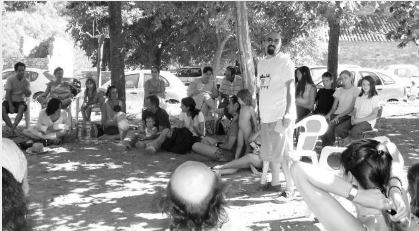
Trobada de grups de criança a Castellnou del Bages.